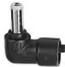
CONTACT OF ADAPTER