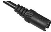
AT END OF CABLE