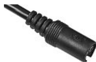
BOUT DU CABLE